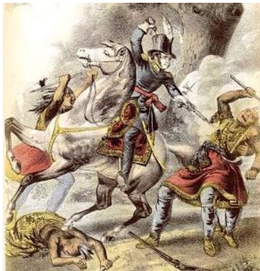
Tecumsehova smrt v bitvě u Thames

Unavený a roztrpčený, spojil se šavanský náčelník s britskou armádou. Věřil, že by mu společným vítězstvím nad nenáviděnými Američany přece jen svitla nová naděje pro jeho velkolepý záměr. Ale osud je k němu nemilosrdný. Tecumseh umírá 5. října 1813 u kanadské Temže v jedné z nevýznamných bitev britsko-americké války. Těsně před bitvou si prý svlékl uniformu s hodností britského generála, která mu byla za jeho zásluhy propůjčena, a vzal si na sebe prostý šat indiánského bojovníka. Věděl, že zemře. A chtěl zemřít jako Indián!