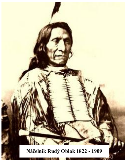
Náčelník Rudý Oblak 1822 - 1909

Lež byla mu nejhnusnější a nejzkázonosnějším hříchem – jeho charakter obdivovali i nepřátelé, kteří lstí dobývali nad ním vítězství.